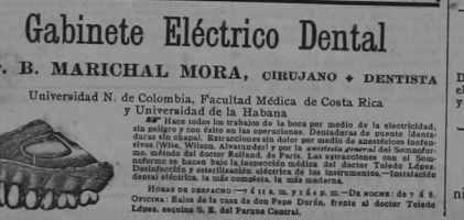
Este documento es propiedad de la Biblioteca Nacional "Miguel Obregón Lizano" del Sistema Nacional de Bibliotecas del Ministerio de Cultura y Juventud, Costa Rica.